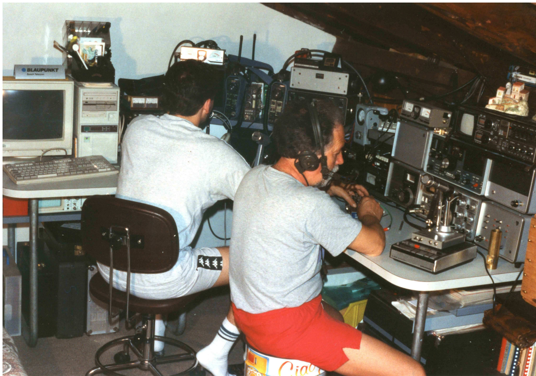
iw3htu & i3zvn

Ritengo opportuno il monitoraggio di tale tratta in particolare dai colleghi i7 dell'estremo sud e iT9, sono praticamente convinto che questo si potrebbe manifestare anche sulle bande più alte, visto la mole di segnali che arrivano dalla zona 7 Brindisi-Lecce quando il condotto funziona.